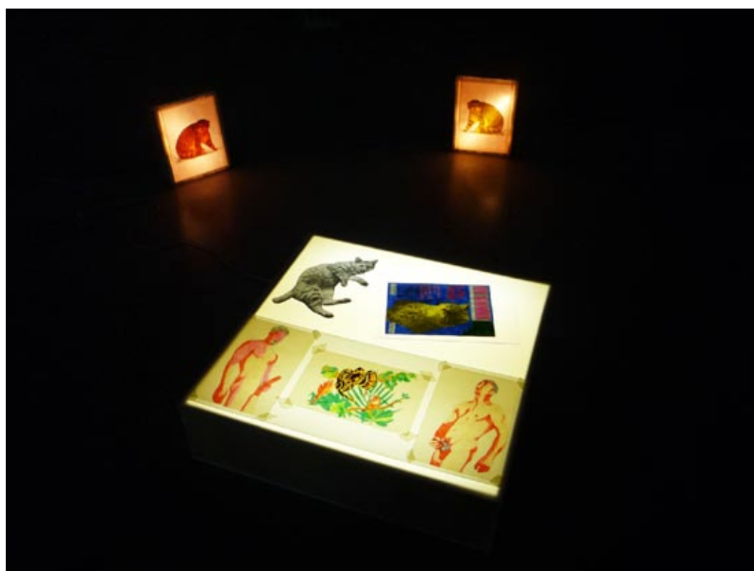
D'amour et d'eau fraîche ; 2010 ; caisson lumineux , dessins , photocopie, collage