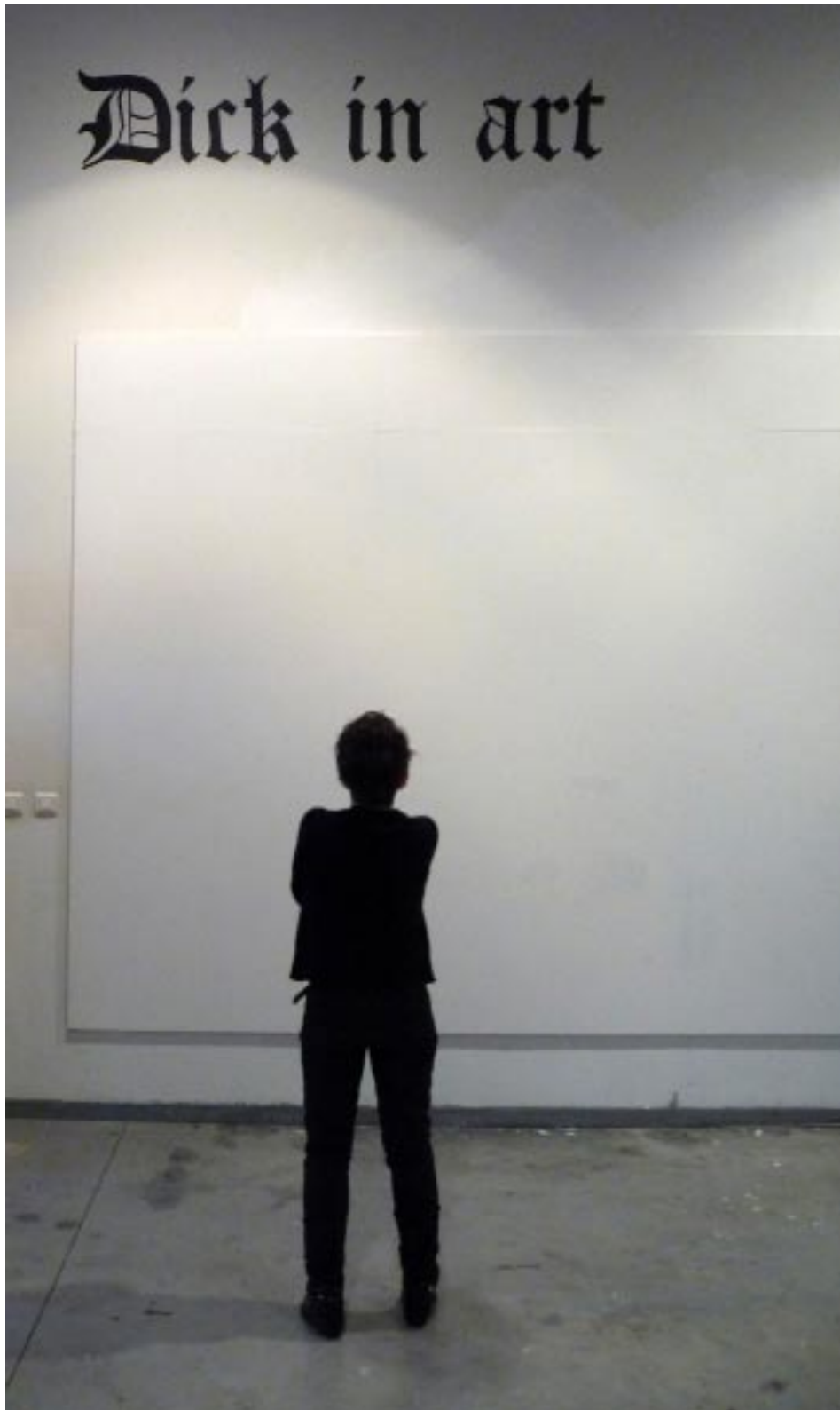
Dick in art ; 2010 ; peinture murale à l'acrylique noire ; 35cm x 200cm , à 4m du sol