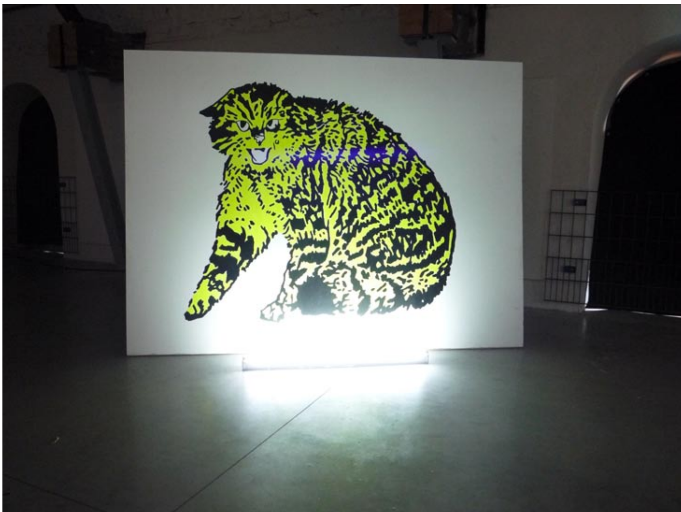
Mon chat sauvage ; 2010 , 200 cm x 170 cm ; acrylique sur bois + néon