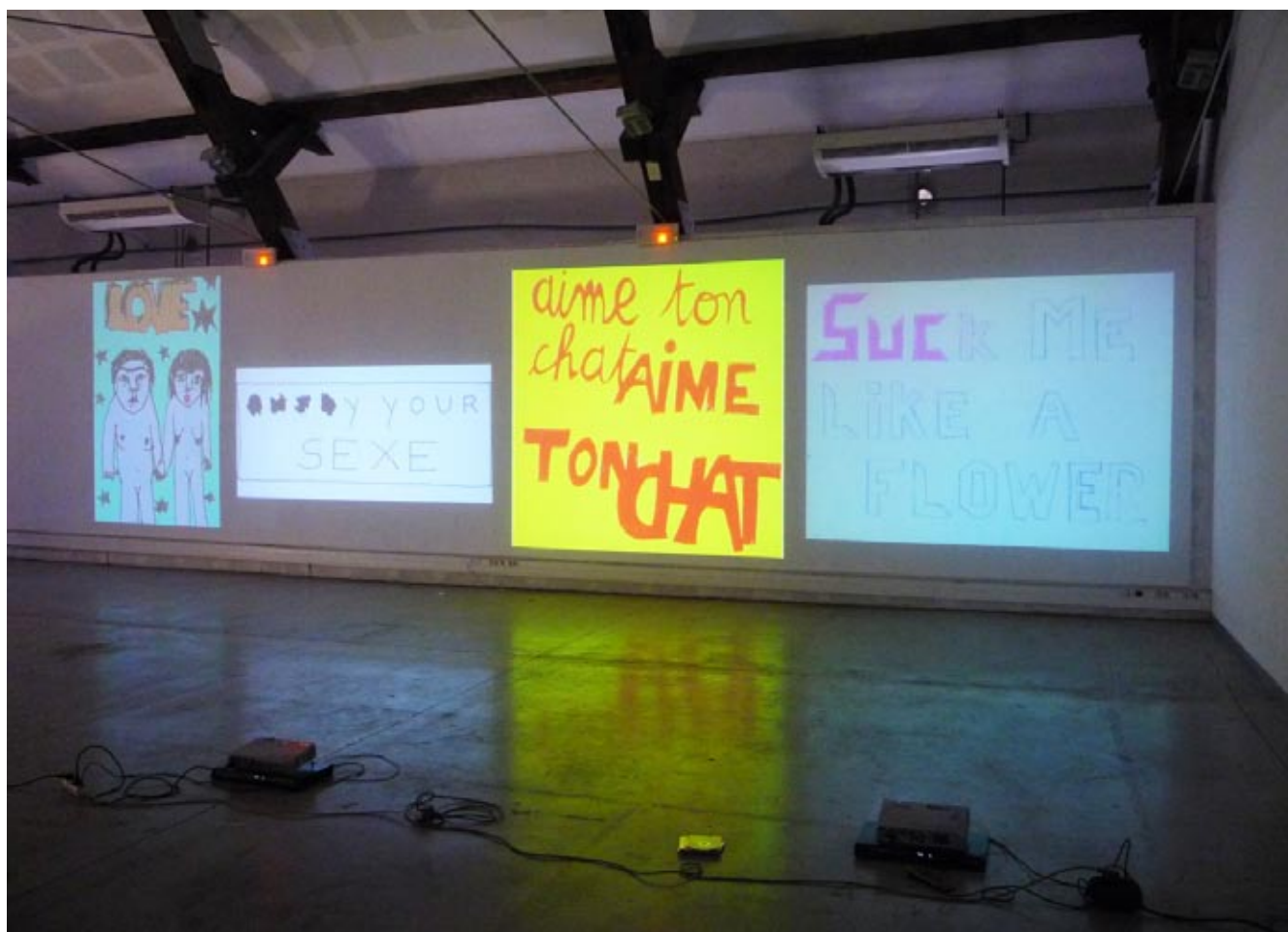
Suce moi fort ; 2010 ; dimensions variables , affiche "à la main" + néon + paysages de gif animés