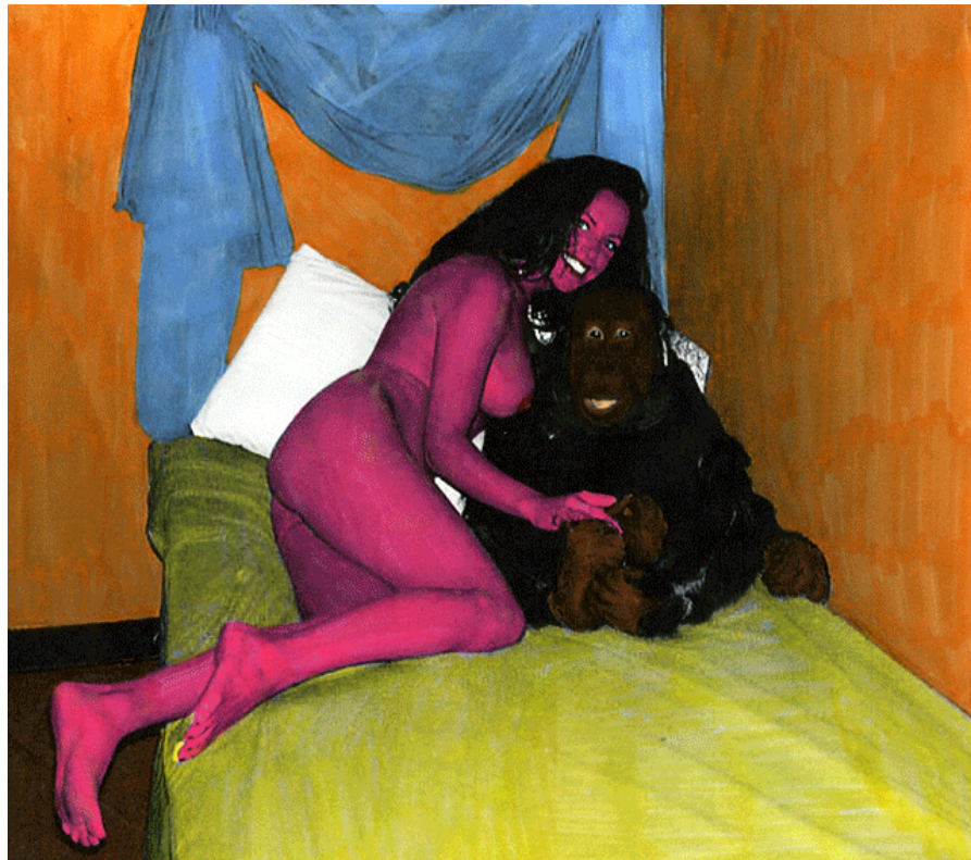
Dame au singe ; 2009 ; feutres sur photocopie

Elle aime les chats, la pornographie et l'amour. Dans son appartement/espace d'impression/do it yourself, elle auto-édite des recueils de poésie et des livres d'images un peu "crades", pour les distribuer sous son manteau à des gens qui aurait envie de se subvertir ou de réfléchir à leur condition d'être humain. Le bureau recèle de tampons, imprimantes, crayons, colles, papiers carbone et magazines en tous genre. Parce que tout est source de message : du magazine "I love cat" à la presse "Sexe for everybody". Burrough scandait "langage is a virus", et de plus en plus de chats portent des prénoms d'être humain.