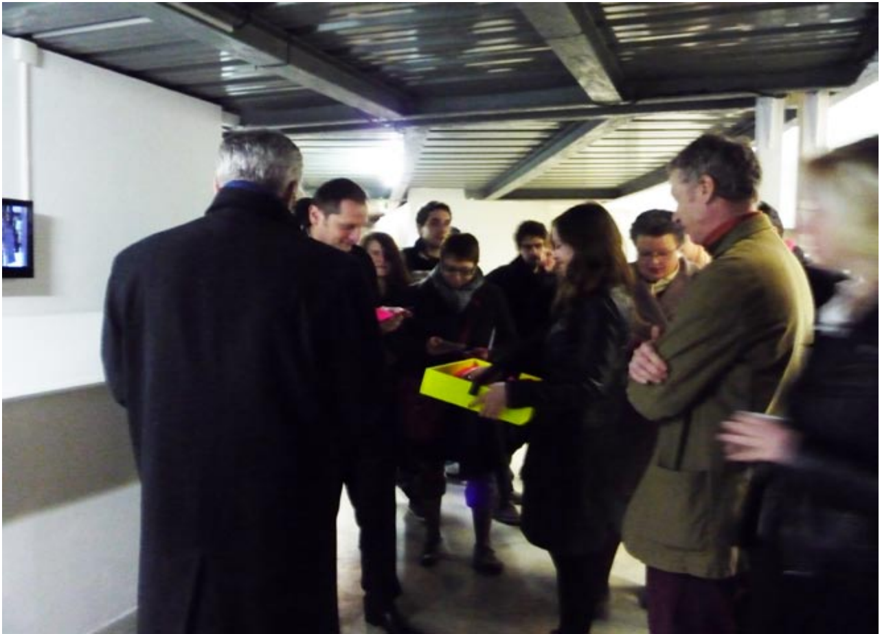
Zoo, I am your sexy bird ; édition limitée, 150 exemplaires ; 2011 ; Les enfants du sabbats XII , le Creux de l'enfer,Thiers ; Distribution le soir du vernissage, avec la participation de Natalia Taravkova