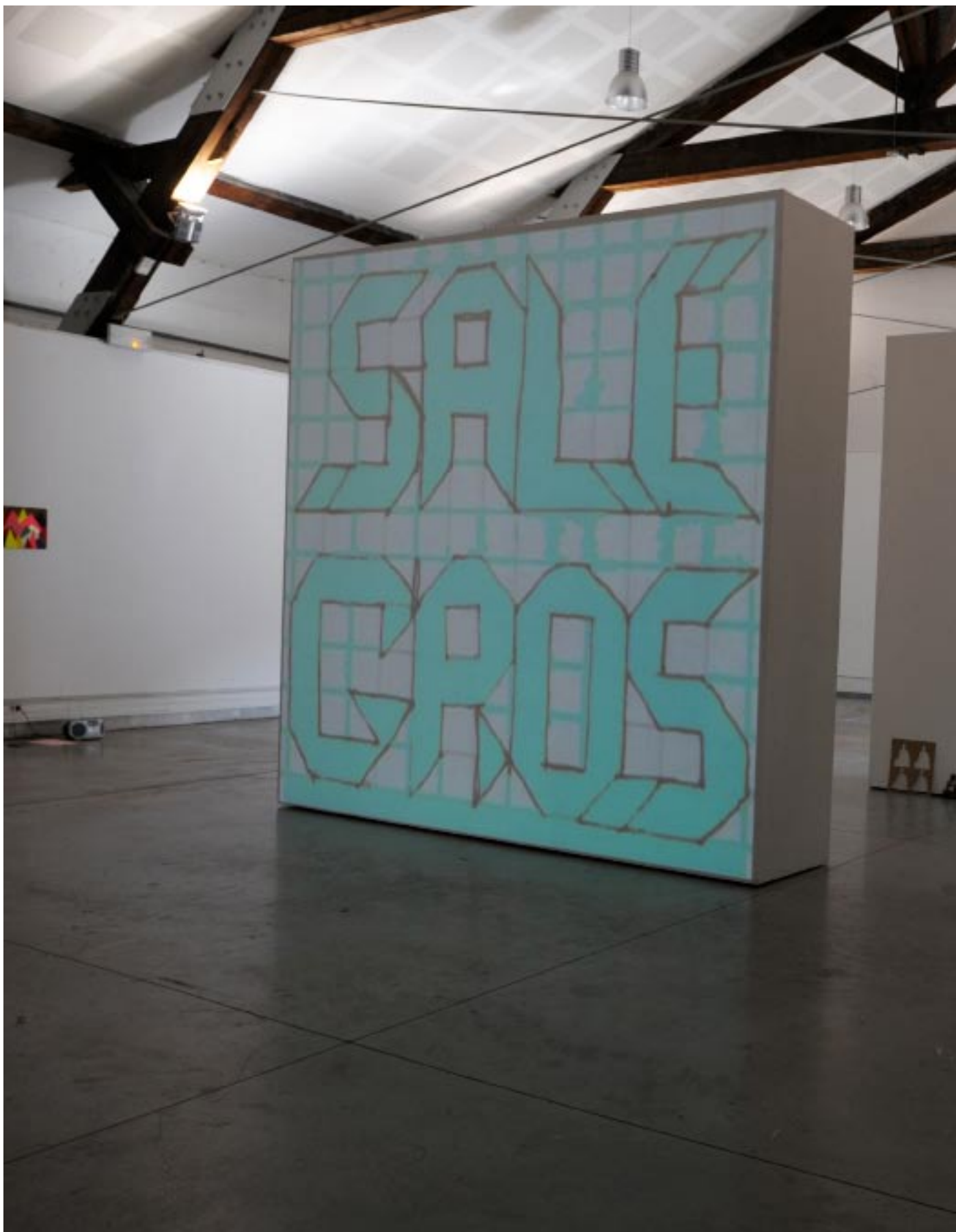
Sale gros ; Gif animé ; 2010 ; projection 350 cm x 350 cm