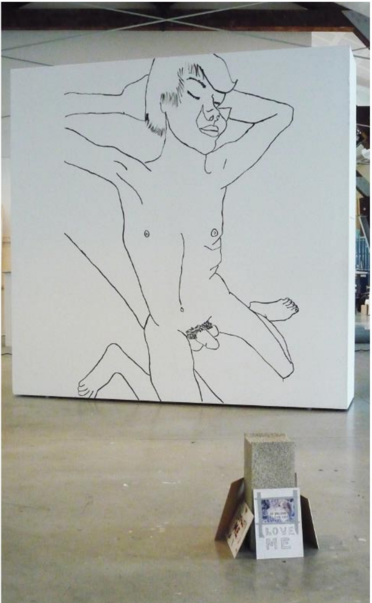
Homme nu ; 2009 ; wall painting ; 250 cm x 300cm + Love me ; dessins, collages , sur moellon