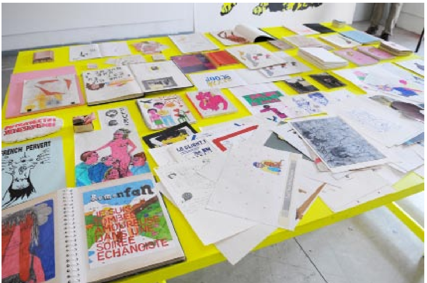
Je suis tombée amoureuse dans une soirée échangiste ; Table d'éditions ; 2010, auto-éditions (feutres, impressions, collages, dessins, textes) sur planches et traiteaux peints ; dimensions variables.